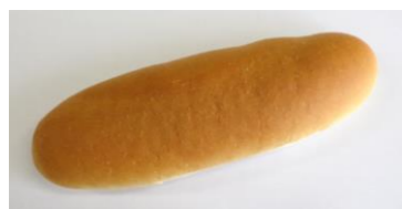
◆減塩パン 塩分を抑えたパン ※包装資材に白色のラインが入ります。