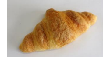
◆クロワッサン (20g, 30g) 行事食献立等に好評