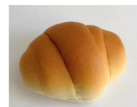
◆バターロールパン 無塩バター 8%配合