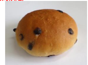
◆チョコレートパン チップチョコ 20%配合

注. 副資材のアレルゲン等に関しては「令和6年度 学校給食パン製品別アレルゲン等一覧」にてご確認ください。