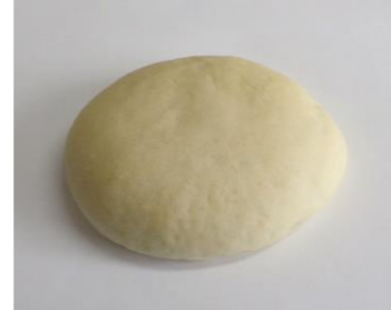
米粉フオカッチャ (30g, 40g, 50g, 60g, 70g) シンプルな味で、和・洋・中さまざまな料理に向いています。(平たく成形するため、形状にばらつきがでる場合があります)