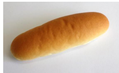
米粉パン (30g, 40g, 50g, 60g, 70g) 宮城県産ひとめぼれを使用した米粉を70%、小麦粉を30%使用しています。