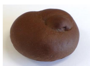
◆ココアパン ココア風味のパン