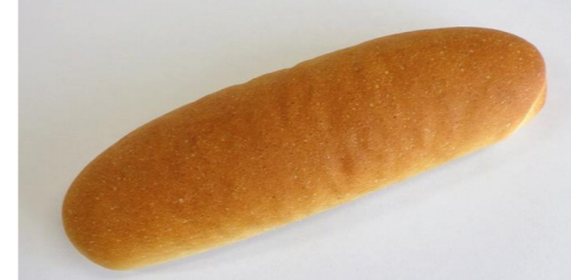
米粉きな粉パン (30g, 40g, 50g, 60g, 70g) 米粉と相性が良い「宮城県産きな粉」を配合することにより、香ばしさを加えた新たな製品です。