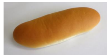
◆ソフトパン ソフトで口当たりの良いパン