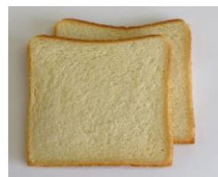
◆豆乳食パン 豆乳と大豆粉を使用した食パン ※包装資材にオレンジ色のラインが入ります。