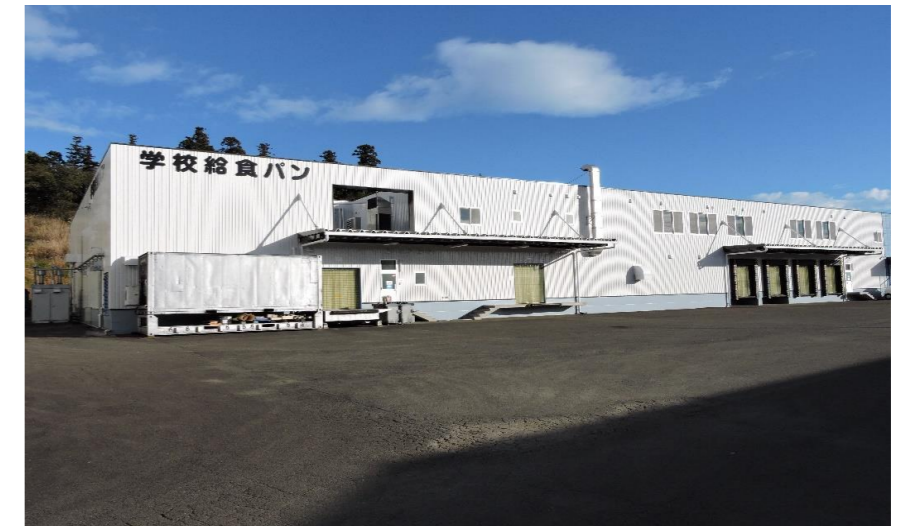
(学校給食パン宮城協業組合 工場外観)