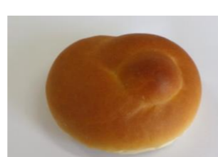
◆ミルクパン 牛乳 30%配合