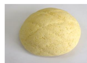
◆メロンパン (30g, 40g, 50g, 60g) お楽しみ献立に最適