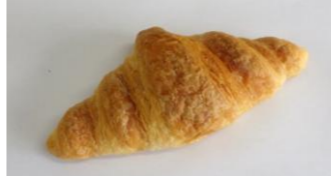
◆クロワッサン (20g, 30g) 行事食献立等に好評