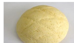
◆メロンパン (30g, 40g, 50g, 60g)