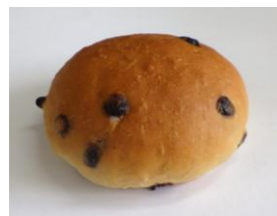
◆チョコレートパン