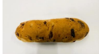
◆チーズパン 角切チーズ 20%配合