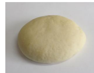
米粉フォカッチャ